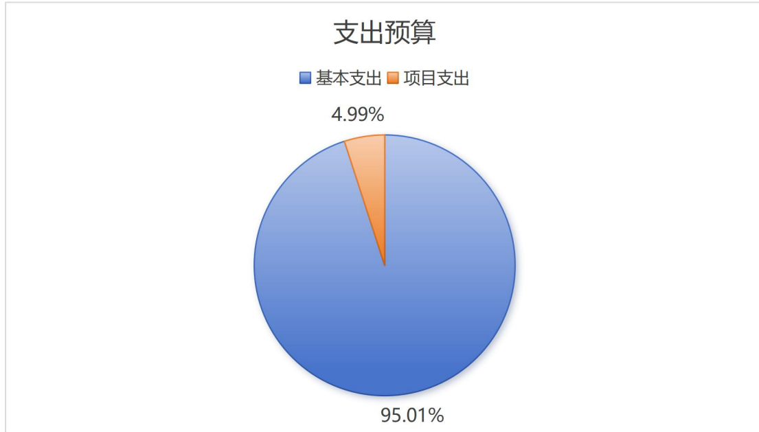
图2民航三亚监管局2026年支出预算构成

2026年支出预算1,104.52万元，其中：基本支出1,049.37万元，占95.01%；项目支出55.15万元，占4.99%。